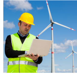
SAHA DURUM TESPİTİ