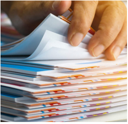
YASAL İZİNLERİN İNCELENMESİ

Rüzgar, güneş ve hidroelektrik santralleri ile karayolları, konut, otel gibi inşaat projelerinde kredi veren kuruluşlara ve yatırımcılara teknik danışmanlık hizmeti sağlamaktayız.